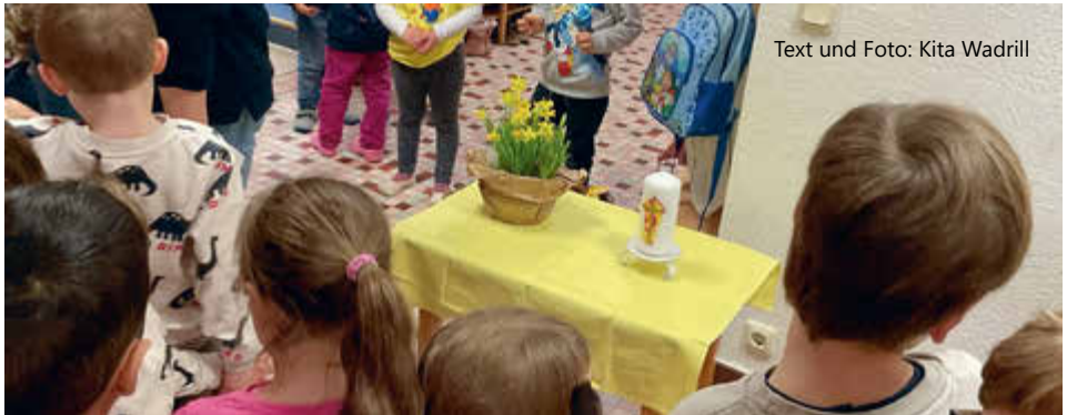
Text und Foto: Kita Wadrill

Auch der Karfreitag ist ein wichtiger Teil