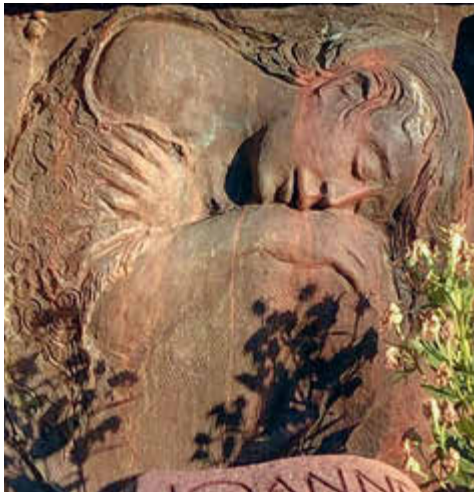
Bild: Ernst Alt, Bronzerelief für ein Grabmal

Im August 2026 beginnt ein Kurs für Frauen und Männer, die andere Menschen nach dem Tod einer nahestehenden Person ehrenamtlich in ihrer Trauer begleiten möchten.