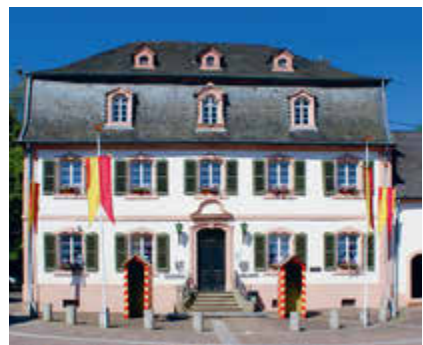
Startpunkt: Öttinger Schlösschen

Alle sind angesichts des schon über 4 Jahre dauernden Krieges in der Ukraine und der anderen Kriege weltweit eingeladen, an all jene zu denken, die unter Krieg und Gewalt leiden und sich für eine selbstbestimmte Zukunft einsetzen.