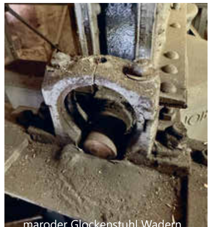
maroder Glockenstuhl Wadern