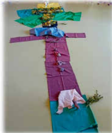
Text und Foto: Sandra Meyer, Kita Lockw.

Den Abschluss bildete eine gemeinsame Osterfeier im Bewegungsraum. Hier bekamen wir Unterstützung von Tanja Buchheit-Thewes. Dort wurde die ganze Ostergeschichte noch einmal gemeinsam aufgegriffen und vertieft. Mit Hilfe von Tüchern in unterschiedlichen Farben und Stimmungen wurde der Weg Jesu symbolisch dargestellt. Bekannte Symbole aus den vorherigen Tagen wurden erneut aufgegriffen und von den Kindern aktiv eingebracht. Es entstand